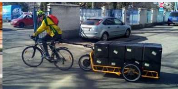
Standard bicycle with trailer