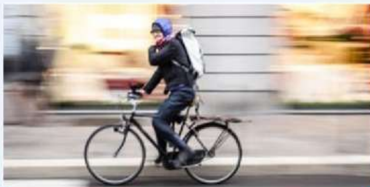
Standard bicycle with shoulder bag or panniers