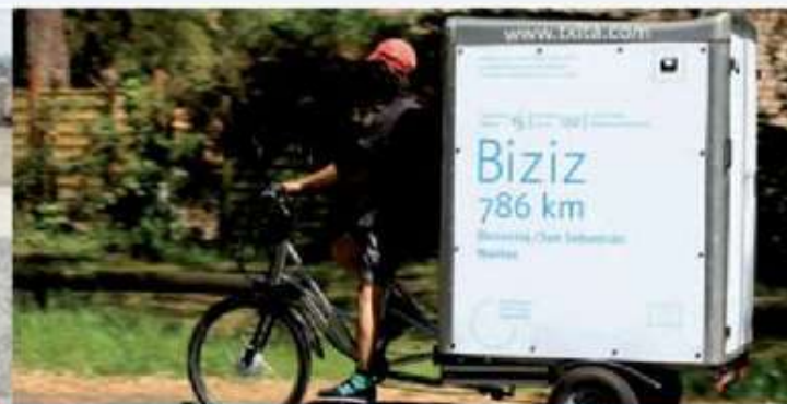
Cargo trike / quad