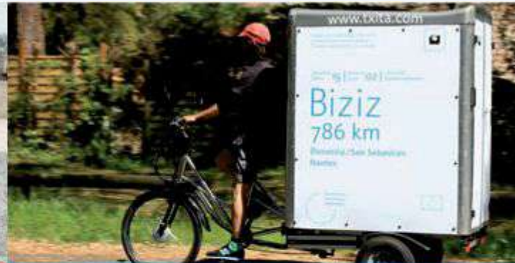
Cargo trike / quad