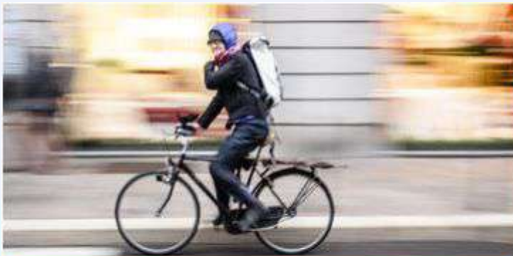
Standard bicycle with shoulder bag or panniers