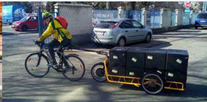
Standard bicycle with trailer