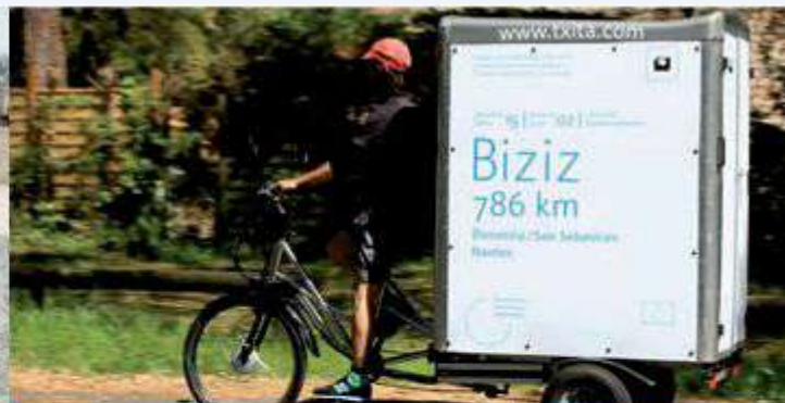
Cargo trike / quad