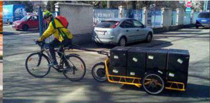
Standard bicycle with trailer