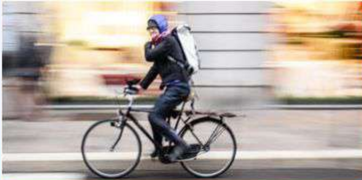
Standard bicycle with shoulder bag or panniers